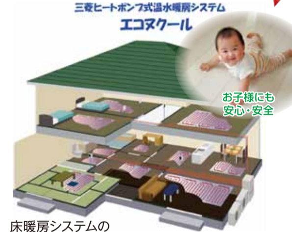
床暖房システムのイメージ