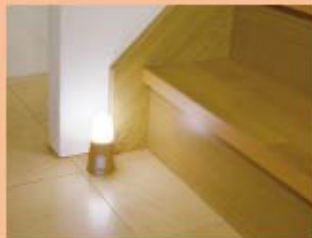
昼白色のほか電球色もある。(アイリスオーヤマ「乾電池式屋内センサーライト」)

LED照明です。周囲が暗くなり、人が近づいたときに10秒間ほど点灯します。乾電池式なのでコンセントがない場所に便利。逆さにして吊り下げることができ、クローゼットのなかなど、明かりが届きにくいところでも重宝します。高齢者にはまぶしくない光がおすすめです。