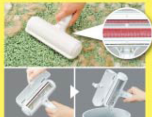
エチケット®ブラシのメーカーが開発。(日本シール「N77 ばくばくローラー」)

手で前後に軽く動かすとローラーが回転し、特殊な繊維が絨毯などについたホコリや糸くず、ペットの抜け毛などをからめとります。電気を使わないので省エネに、粘着テープを使用しないので節約になります。たまったゴミは蓋をあけてゴミ箱に。寝具などの掃除にも便利です。